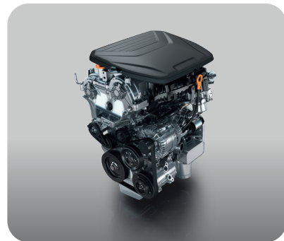
Motor 1.5 Turbo