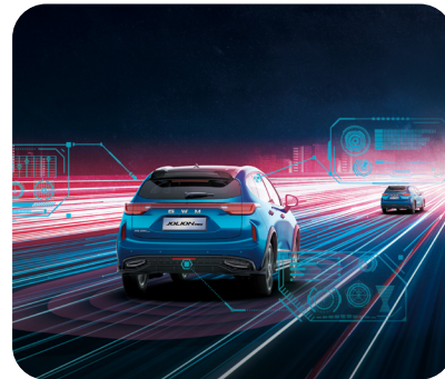
Sistema de control crucero