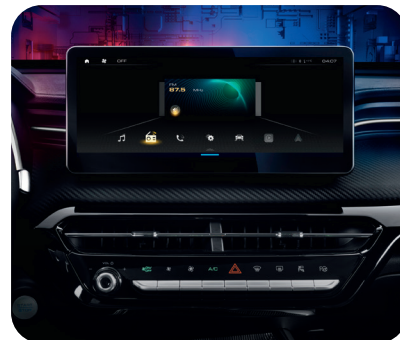
Multimedia pantalla Táctil 12.3" con Bluetooth, Apple y Carplay